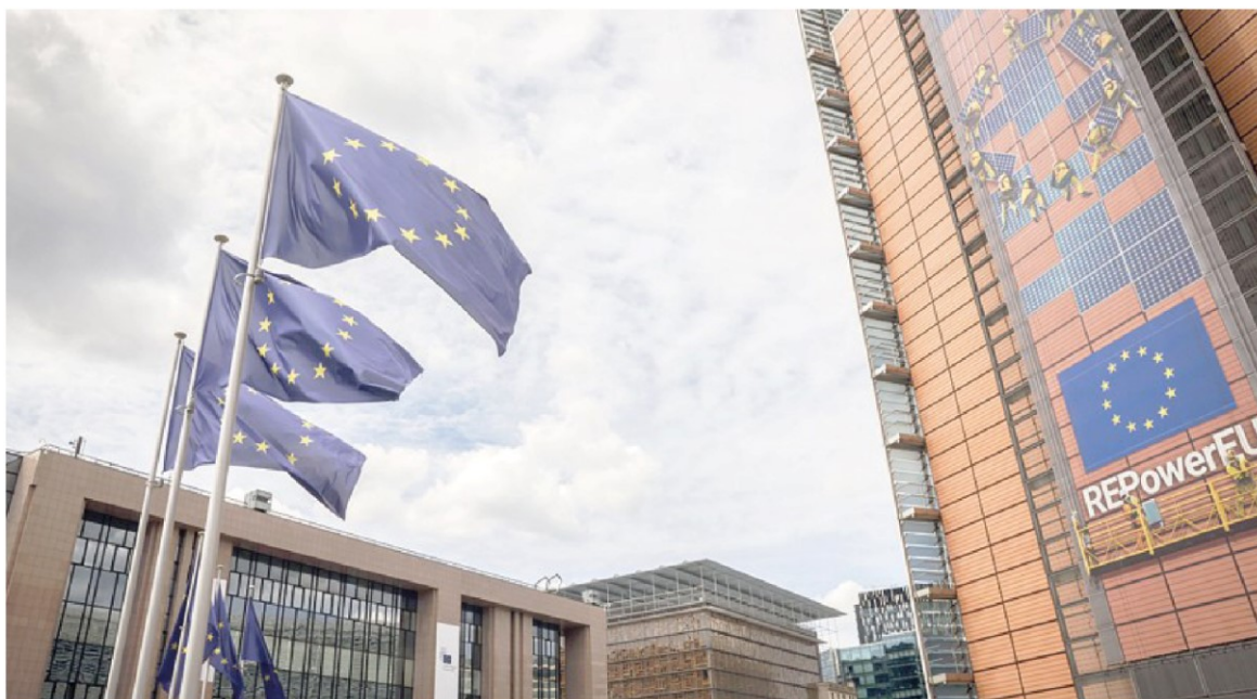
Una complicata svolta green. Le norme europee rischiano di mettere in difficoltà le imprese